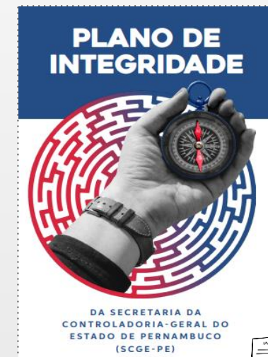
Plano de Integridade da Secretaria da Controladoria Geral de Pernambuco (2020)