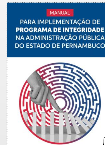
Manual para Implementação de Programa de Integridade na Administração Pública (2021)

Art. 7º Compete à SCGE apoiar a implementação do PPMI, por meio da expedição de orientações e normas complementares , bem como avaliar a sua execução .